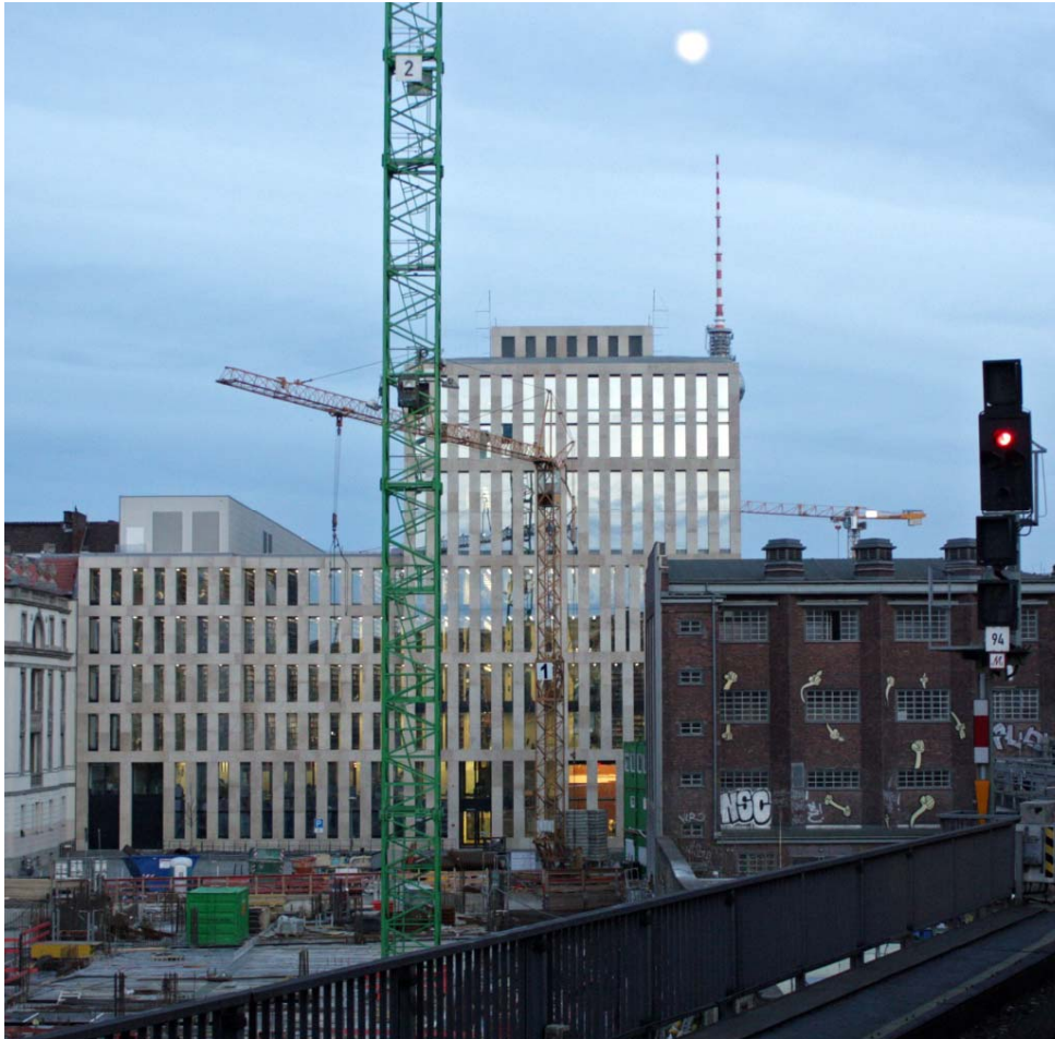
Jacob- und Wilhelm Grimm-Zentrum, Berlin am späten Nachmittag